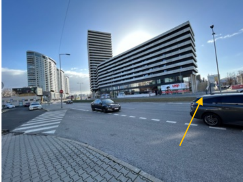
Hauptstraße vor der Rampe

office@sksturm.at T +43 316 771 771 F +43 316 771 771-77